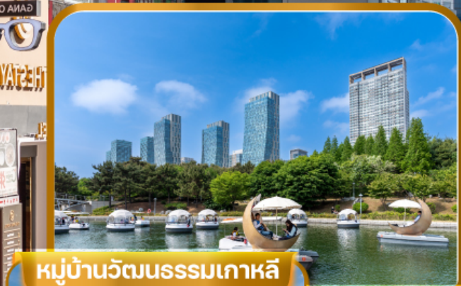
หมู่บ้านวัฒนธรรมเกาหลี

อควาเรียมมีเดียอาร์ต | ซองโดเซนทรัลพาร์ค คาเฟ่ลับ ที่ห้ามพลาด | หมู่บ้านวัฒนธรรมเกาหลี วัดโซเกชชา | ฮงแดเวิร์คกิ้งสตรีท เที่ยวอิสระ 1 วันเต็ม