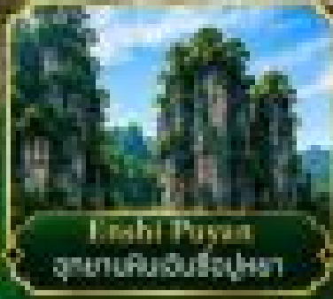
Enshi Puyuan อุทยานผิงฮาน