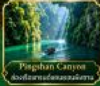
Pinghan Canyon ฮังซียงแกรนด์แคนยอน