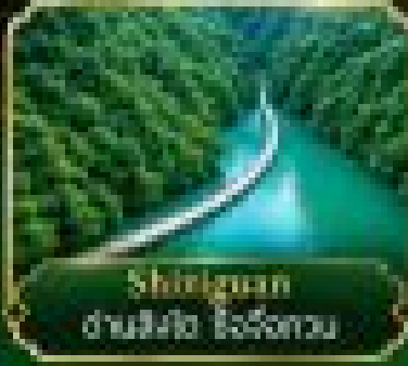
Shilinguan เขื่อนฮังจื่อทวน