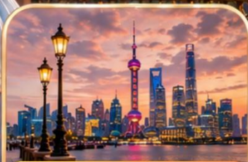
THE BUND (หาดไวทง)