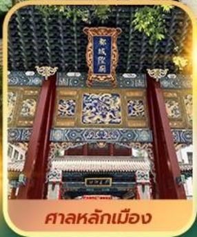
ศาลหลักเมือง