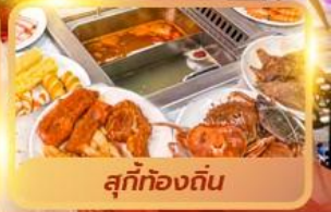
สุกี้ท้องถิ่น