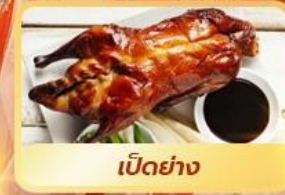
เป็ดย่าง