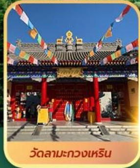
วัดลามะกวงเหริน