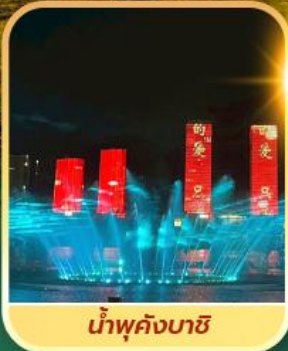
น้ำพุคังบาชิ