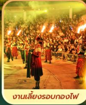
งานเลี้ยงรอบกองไฟ