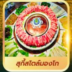
สุกีสโตล์มองโก