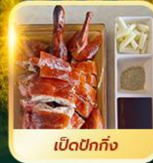
เบ็ดปักกิ้ง