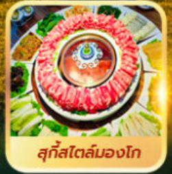
สุกีสโตล์มองโก