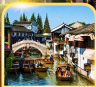
เมืองโบราณจูเจียเจี่ยว