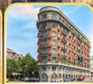
อาคารอู่คัง