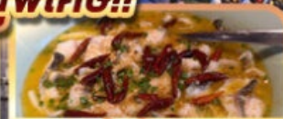
ปลาต้มผักกาดดอง