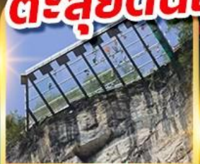
ระเบี่ยงแก้วอุ๋หลง