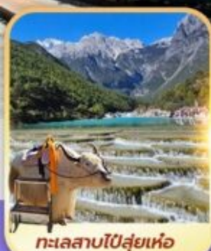
ทะเลสาบปี่สุ่ยเห่อ