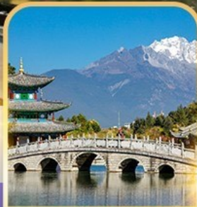
สะพานม้งกรดำ