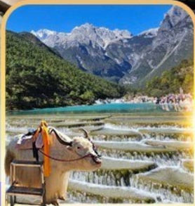
ทะเลสาบปิสู่ยเหอ