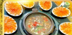
สุกี้ปลาแซลมอน