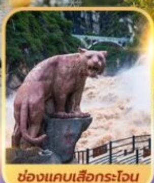
ช่องแคบเลื่อกระโจน