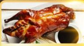
เปิด Four Season