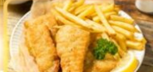
Fish and Chips