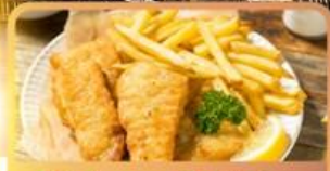
Fish and Chips