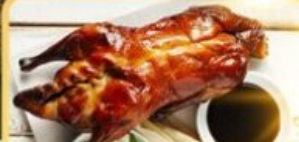
เปิด Four Season