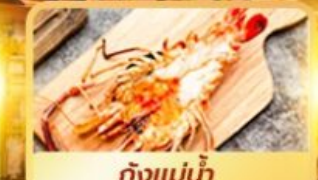
กุ้งแม่น้ำ