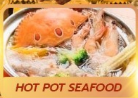
HOT POT SEAFOOD