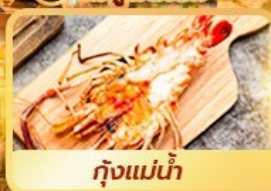
กุ้งแม่น้ำ