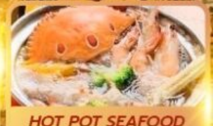
HOT POT SEAFOOD