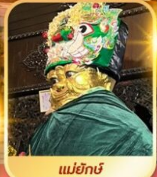
แม่ยักษ์