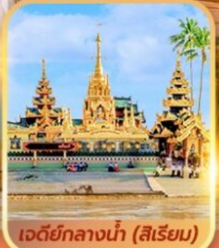
เจดีย์กลางน้ำ (สิริเยม)