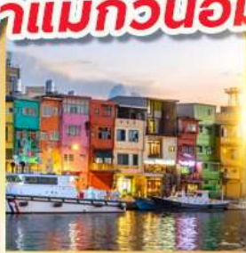
ท่าเรือประมงเจิ้งปิ่น