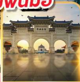
อนุสรณ์เจียงไคเชค