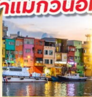
ท่าเรือประมงเจิ้งปิ่น