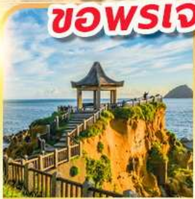
เกาะเหอผิง

พักย่านซีเหมินติง 2 คืน ขอพรเจ้าแม่กวนอิมพันมือ