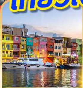
หมู่บ้านประมงเจิ้งปิ่น

พักชั้เหมินต้ง 1 คืน เที่ยวเต็ม!! ไม่มีอันอิสระ