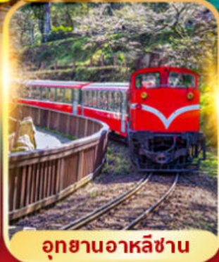
อุทยานอาลีซาน