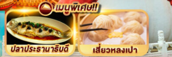
ปลาประจักษ์ริบตี