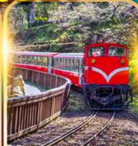
อุทยานอาหลี่ซาน