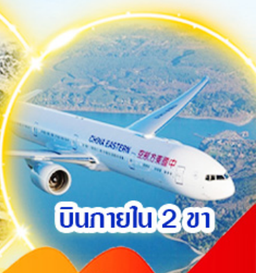
บินภายใน 2 ชม