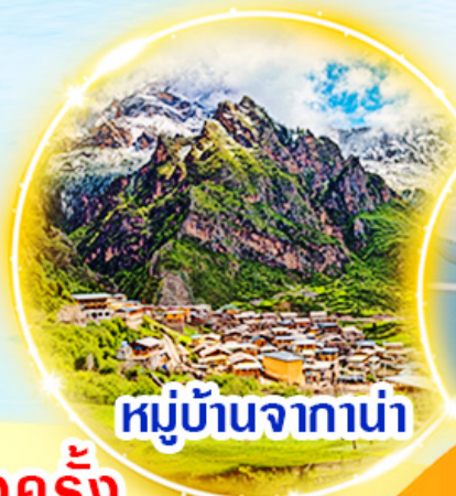
หมู่บ้านจาก่าน่า