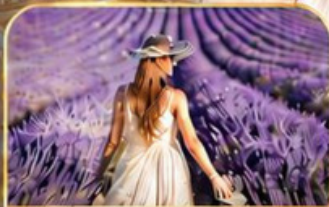
ทุ่งดอกลาเวนเดอร์