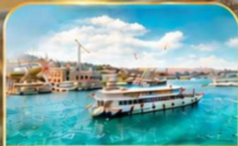
ล่องเรือ BOSPHORUS