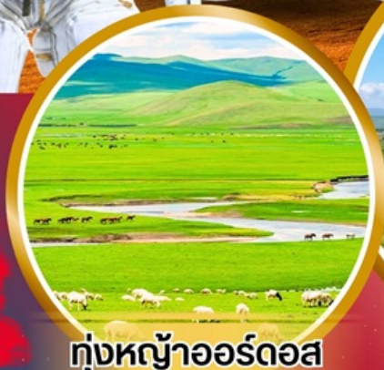
ทุ่งหญ้าออร์โดส

พิเศษ!!! สวมชุดของโกเลีย บนกระโจมของโกเลีย