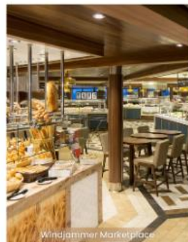
Windjammer Marketplace WINDJAMMER