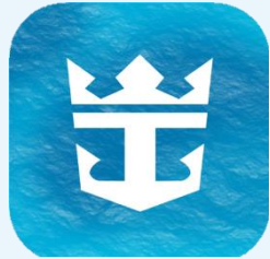
Royal Caribbean International App.

- โหลดแอป Royal Caribbean ไว้ในมือถือ เพื่อลงทะเบียน และ โหลดตั๋วเรือสำราญ