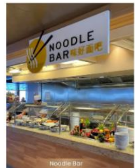
Noodle Bar NOODLE BAR