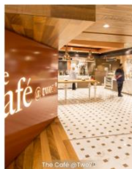
The Café @ 270 CAFE 270