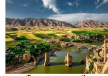
เมืองฮาซานคีฟ

** พักที่ Kardelen Hotel 4* หรือเทียบเท่า **