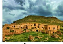
เมืองดารา

** พักที่ Kardelen Hotel 4* หรือเทียบเท่า **