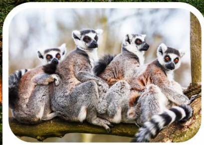
เลมูร์สัตว์ประจำเกาะมาดากัสการ์