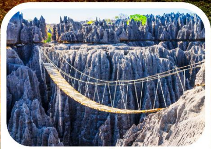
อุทยานแห่งชาติซิงกี เดอ เบอมาราฮา