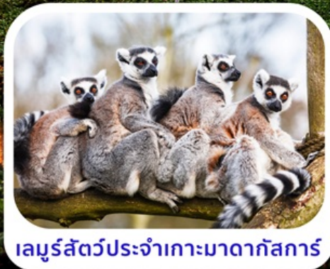
เลมูร์สัตว์ประจำเกาะมาดากัสการ์