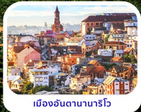
เมืองอันตานานารีโว