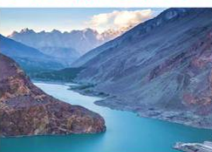
ทะเลสาบอิตตาบัด