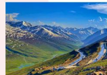
หุบเขา Naran Kaghan

** พักที่ Besham Continental Hotel หรือเทียบเท่า **