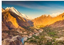
Nanga Parbat Viewpoint

** พักที่ Hunza Darbar Hotel หรือเทียบเท่า **