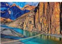
สะพานแขวนฮุสไซนี