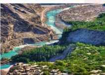
ป้อมปราการ Altit Fort