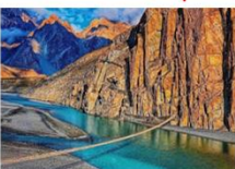
สะพานแขวนฮุสไซนี

DAY6 สะพานแขวนฮุสไซนี-กิลกิต-พระพุทธรูปคาร์กาห์