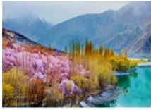
เมืองชิลาส

** พักที่ Shangrila Chilas Hotel หรือเทียบเท่า **