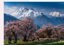
Nanga Parbat Viewpoint

** พักที่ Besham Hilton Hotel หรือเทียบเท่า **