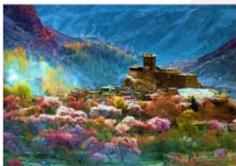
ป้อมปราการ Altit Fort

DAY4 CHERRY BLOSSOM-ป้อมปราการอัลติท-ตลาดพื้นเมือง- ฮอปเปอร์ กลาเซีย-หุบเขาคฺยเกออร์