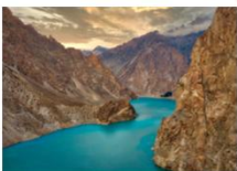
ทะเลสาบอิตตาบัต

** พักที่ Sarai Silk Route Hotel หรือเทียบเท่า **