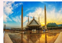
มัสยิดไฟซาล

DAY8 ตึกศิลา-พิพิธภัณฑ์ตึกศิลา-อิสลามาบัด- มัสยิดไฟซาล-Shopping-กรุงเทพ