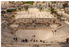
โรงละครโรมัน