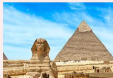
มหาพีระมิดกิซา, สฟิงซ์