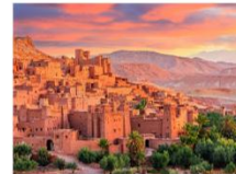
Kasbah Ait Ben Haddou

** พักที่ Oscar Hotel by Atlas Studios Hotel 4* หรือเทียบเท่า **