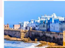
เมืองเอสซาอูอิรา

** พักที่ Hotel Odyssee Center 4* หรือเทียบเท่า **