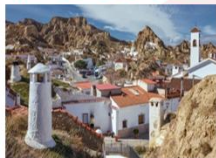
Barrio de Cuevas