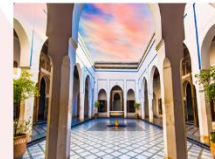
พระราชวังบาเอีย

** พักที่ Palais Riad Bèrbè Hotel 4* หรือเทียบเท่า **