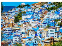
เมืองเซฟซาออน