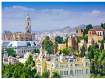
เมืองมาลากา

05.15 น. เดินทางถึงสนามบินอิสตันบูล ประเทศตุรกี แวะเปลี่ยนเครื่องบิน 06.55 น. ออกเดินทางสู่สนามบินมาลากา (AGP) โดยสายการบิน TURKISH AIRLINES เที่ยวบินที่ TK 1303 10.35 น. เดินทางถึงสนามบินมาลากา ประเทศสเปน