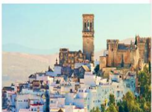
Mirador Plaza del Cabildo