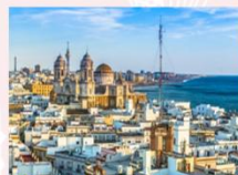
เมืองกาติซ

** พักที่ Puerto Sherry Hotel 4* หรือเทียบเท่า **