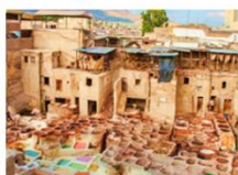
เขตเมืองเก่าเฟซ