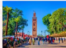
เมืองมาราเกช