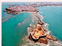
ป้อมปราการซานเซบัสเตียน