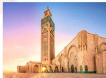
สุเหร่าฮัสซันที่ 2

12.00 น. สมควรแก่เวลานำท่านเดินทางสู่สนามบินคาซาบลังกา (CMN) 16.45 น. ออกเดินทางสู่อิสตันบูล ประเทศตุรกี โดยสายการบินเตอร์กิชแอร์ไลน์ เที่ยวบินที่ TK 618 23.25 น. เดินทางถึงสนามบินอิสตันบูล (แวะเปลี่ยนเครื่อง)