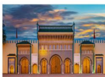
พระราชวังหลวงแห่งเฟซ

** พักที่ Barceló Fès Medina Hotel 4* หรือเทียบเท่า **