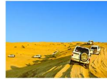
ทะเลทรายซาฮารา

** พักที่ Kasbah Hôtel Tombouctou Hotel 4* หรือเทียบเท่า **