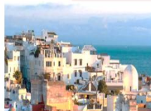
เมืองแทนเจอร์

** พักที่ Riad Cherifa Hôtel Hotel 4* หรือเทียบเท่า **