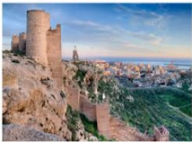
ป้อมอัลคาซาบา