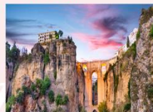
สะพานหินโบราณ Puente Romano

** พักที่ Parador de Ronda Hotel 4* หรือเทียบเท่า **