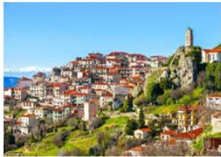
เมืองอราคอว่า

05.10 น. เดินทางถึงสนามบินอิสตันบูล แวะเปลี่ยนเครื่อง 07.30 น. ออกเดินทางสู่กรุงเอเธนส์ เที่ยวบิน TK1843 08.55 น. เดินทางถึงสนามบินกรุงเอเธนส์ ประเทศกรีซ