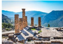
วิหารเทอพอลโล

** พักที่ Divani Meteora Hotel 4* หรือเทียบเท่า **