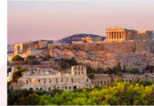
กรุงเอเธนส์

** พักที่ The Stanley Hotel 4* หรือเทียบเท่า **