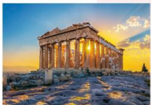
วิหารพาร์เธนอน

** พักที่ The Stanley Hotel 4* หรือเทียบเท่า **