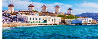
เกาะมิโคนอส

** พักที่ Camarades Hotel 4* หรือเทียบเท่า **