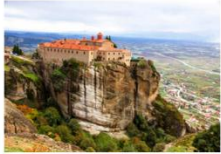
สำนักสงฆ์แห่งเมทีโอรา

** พักที่ The Stanley Hotel 4* หรือเทียบเท่า **