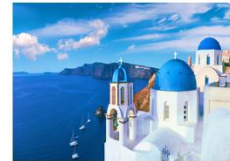
เกาะซานโตรินี่

** พักที่ Aelia Suites Karterados Hotel 4* หรือเทียบเท่า **