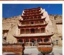
ถ้ำม้อเกาถู