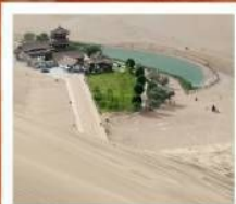
เป็นทรายหิมชซาซาน