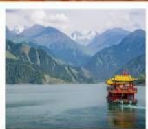
ช่องเรือทะเลสาบเทียนฉือ