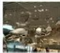
พิพิธภัณฑ์วิทยาศาสตร์