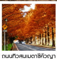
ถนนทิวสนเมตาชิคิวญา