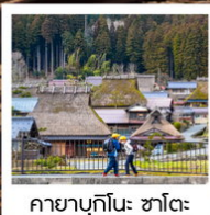
คายาบุกิโนะ: ซาโตะ