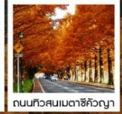
ถนนทิวสนเมตาชิคังญา