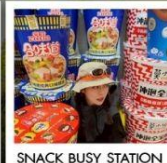
SNACK BUSY STATION