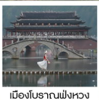
เมืองโบราณฟังหวง