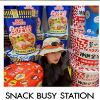
SNACK BUSY STATION