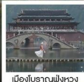
เมืองโบราณฟังหวง