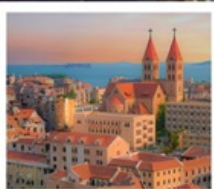
โบสถ์ ST. EMIL