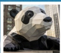
ห้าง IFS แพนด้าป็นตึก