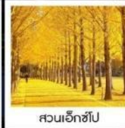
สวนเอ็กซ์โป