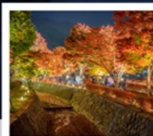
อุโมงค์เมบิล