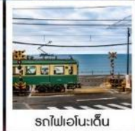
รถไฟเอโนะเด็ง