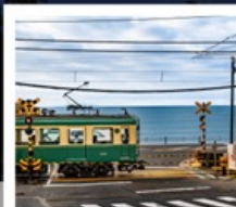
รถไฟเอโนะเดิน