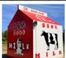
ฟาร์มโคนมจินเหมิน