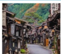
หมู่บ้านโบราณนารายิ จุกุ