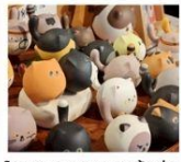
โรงงานเซรามิกเตาเอ๋อด่าง