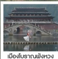
เมืองโบราณฟังหวง