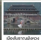
เมืองโบราณฟังหวง