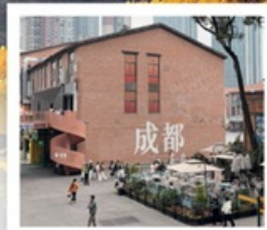
EASTERN SUBURB MEMORY