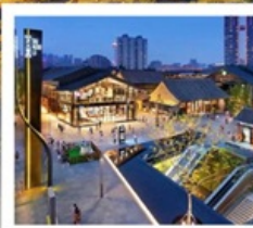
ถนนคนเดินไท่กู่หฺสึ