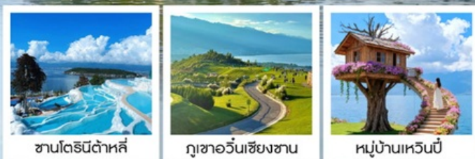
ซานโตรินี่ต้าหลี่

“เกาะเสี้ยวผู่...เกาะลึกลับกลางทะเลสาบ เอ้อไห้”