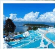
ซานโตรินี่ต้าหลี่