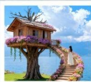
หมู่บ้านเหวินปี้