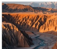
แกรนด์แคนยอนตู้ซานจื่อ