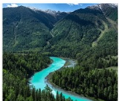
อุทยานคานาสือ

สวนม้าป่าโบราณ / ทางด่วนทะเลทราย S21 เขตกบฏศาสตร์ยาร์ดิง / เขตปีศาจทะเล (รวมล่องเรือ) / ไซโปซ่า ทุ่งหญ้าอาเหอกังไก่ / หมู่บ้านเหมอมู่ซุน (รวมรถอุทยาน) / จุดชมวิวฮาดิง ล่องเรือทะเลสาบคานาสือ / จุดชมวิวกานาสือศาลาชมปลา / ทะเลสาบวงพระจันทร์ ทะเลสาบมังกรหลับ / ทะเลสาบกุวตา / ธารน้ำ 5 สี / เมืองปีศาจ (รวมรถไฟเล็ก) แกรนด์แคนยอนตู้ซานจื่อ / ตลาดต้าปาจา