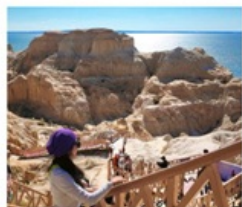
เขตปีศาจทะเล