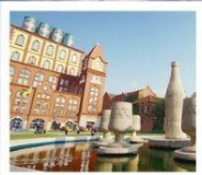
โรงงานเบียร์ชิงเต่า