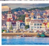
ท่าเรือประมงเขียนโก๋

เรือลิวส์ / ย่านฮั่นเล่อฟาง / ถนนฮั่วจวิปา ท่าเรือประมงเขียนโก๋ / ย่านฮงโหว่1920 / ถนนโบราณเฉาหยาง หอคอยกาลเวลา / ชายหาดจินซา / รูปปั้นปลาวาฬ / หาดทรายซาจื่อโหว่ หาดไซเบอร์ NO.3 / โรงงานเบียร์ชิงเต่า / โบสถ์ St. Emil ถนนคนเดินไต้ตง / สะพานจันเฉียว / จตุรัส 54 / ห้าง MIXC