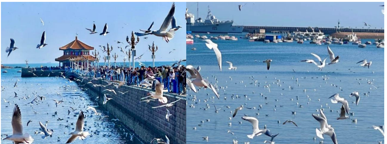
เที่ยง บ่าย ☉ รับประทานอาหารกลางวัน เมนู...อาหารซีฟู้ด นำท่านชม จัตุรัส 54 สัญลักษณ์ของเมืองชิงเต่า สร้างขึ้นเพื่อเรียกร่องเมืองชิงเต่าคืนจากญี่ปุ่นใน วันที่ 4 พ.ค. ปี ค.ศ. 1919