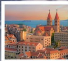
โบสถ์ ST. EMIL

ชิงเต่า · เว่ยไห่ · เขียนโก๋ 6 DAYS 4 NIGHTS