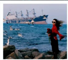
เรือควิวส

หอคอยกาลเวลา / รูปปั้นปลาวาฬ / ถนนโบราณเตาหยาง / ย่านสงไห่ 1920 / เมืองเว่ยไห่ / ถนนฮัวจวิปา / จตุรัสประติมากรรมความสุข ย่านอันลอฟาง / เรือควิวส / หาดซาจื่อฮั่ว / ถนนหลงเจียง / สะพานจันเจียว / หาดไซเบอร์ No. 3 ถนนจงซาน / โบสถ์ St.Emill / จตุรัส 54 / ศูนย์เรือใบโอลิมปิก / พิพิธภัณฑ์มิแยร์ชิงเต่า / ถนนโตตง / ท่าเรือประมงเหยียนโกะ