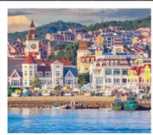
ท่าเรือประมงเหยียนโกะ