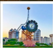
นาฬิกาตวรรษ