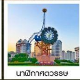
นาฬิกาตวรรษ