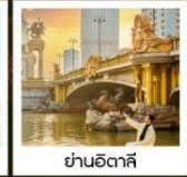
ย่านอิตาลี