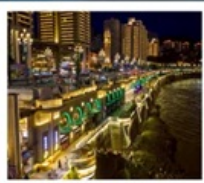
ถนนหนานปิ่น