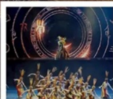
โชว์เว่ยชิว

เซี่ยงไฮ้ คลาสสิก ไนท์ (Shanghai Classic Night) หุบเขาเทวดาวังเซียนกู่ (ชมบรรยากาศกลางวันและกลางคืน) หมู่บ้านโบราณหวงหลิ่ง (รวมกระเช้าไปกลับ) สะพานกระจก ถนนโบราณกุนซี / โชว์การแสดงเว่ยชิว / หมู่บ้านโบราณเฉิงชาน ถนนหวยไห่ (ร้านกระเป๋าสองมอนต์) / เช็กเมนู 3 ตึกใหญ่แห่งเซี่ยงไฮ้ Tian An 1,000 Trees / North Bund Green Land / ถนนอู่กิง