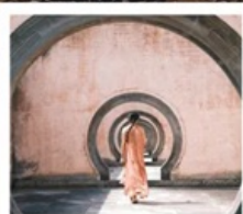
หมู่บ้านโบราณเฉิงชาน