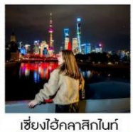
เซี่ยงไฮ้คลาสสิกไนท์