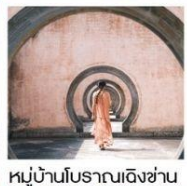
หมู่บ้านโบราณเฉิงชาน