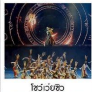
โชว์เว่ยซิว