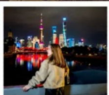
เซี่ยงไฮ้คลาสสิกไนท์