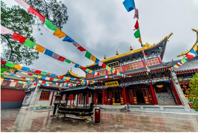
พาท่านชม วัดลามะกว้างเหริน (Guangren Temple) (ระยะทางประมาณ 5 กิโลเมตร ใช้เวลาเดินทางประมาณ 10-15 นาที)

วัดพุทธทิเบตที่เก่าแก่ในเมืองซีอานและเป็นวัดลามะเพียงแห่งเดียวของมณฑลส่านซี วัดกว้างเหรินเปรียบเสมือนสัญลักษณ์ของความสัมพันธ์ทางวัฒนธรรมระหว่าง 'ฮั่น' และ 'ทิเบต' เคยผ่านการบูรณะมาแล้วหลายต่อหลายครั้ง วัดลามะแห่งเดียวในนครซีอานนี้สร้างขึ้นเมื่อ ค.ศ. 170 เป็นสถานที่ที่ผสมผสานวัฒนธรรมจีนและทิเบตอย่างลงตัว