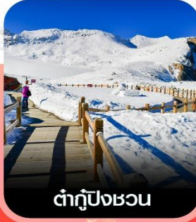
ต่ากู่ปิงชว่น