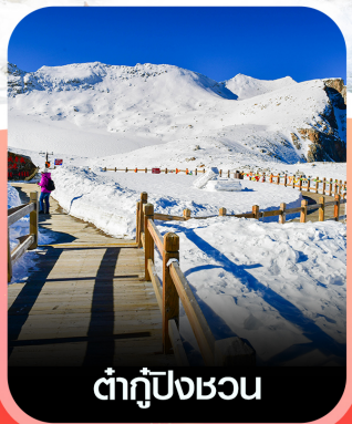
ต้ากู่ปิงชวน