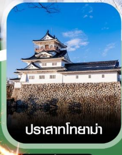
ปราสาทโทยาม่า