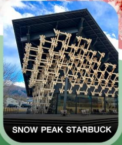
SNOW PEAK STARBUCK