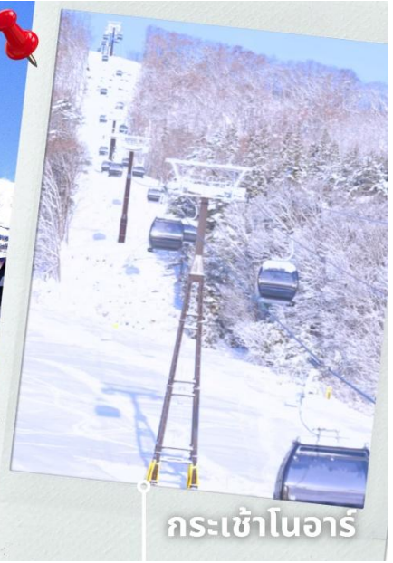
กระเช้าโนอาร์