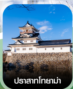
ปราสาทโทยาม่า