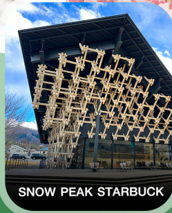
SNOW PEAK STARBUCK

✈️ คอนเฟิร์มออกเดินทาง ✈️ ทุกพีเรียด 2 ท่านขึ้นไป