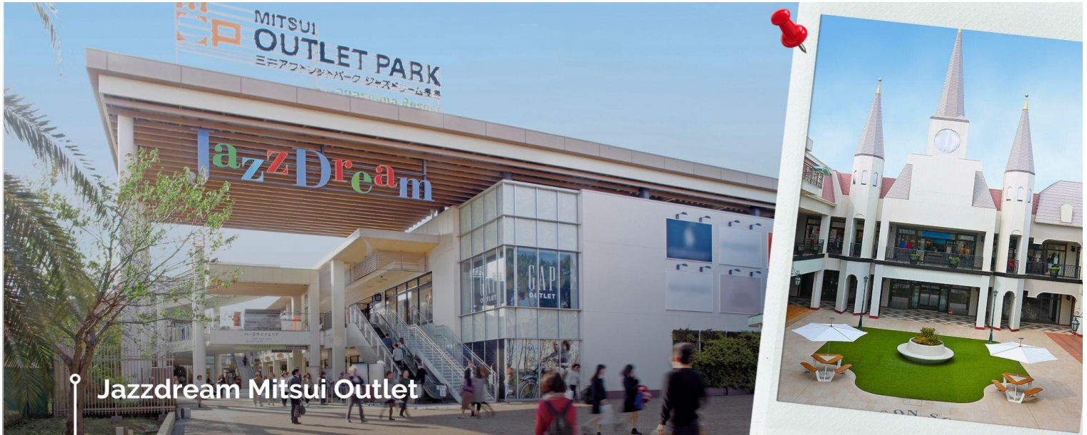
Jazzdream Mitsui Outlet

ทางเดินได้ทั่วทั้งภูเขาอินาริ ที่เชื่อกันว่าเป็นภูเขาศักดิ์สิทธิ์ โดยเทพอินาริจะเป็นตัวแทนของความอุดมสมบูรณ์ การเก็บเกี่ยวข้าว รวมไปถึงพืชผลไร่ต่างๆ และจะมีจิ้งจอกเป็นสัตว์คู่กายเราจึงจะเห็นรูปปั้นจิ้งจอกอยู่จำนวนมาก ภายในศาลเจ้าแห่งนี้ ทางด้านหลังศาลเจ้าจะเป็นทางเดินขึ้นเขา ที่ปกคลุมไปด้วยเสาโทริอิ นอกจากนี้ยังมีร้านอาหารท้องถิ่นและร้านขนมต่างๆให้ท่านได้เลือกชิม และอิสระเดินเที่ยวชมตามอัธยาศัย จากนั้นนำท่านช้อปปิ้งไปที่ Jazzdream Mitsui Outlet ซึ่งเป็น Outlet ที่มีร้านค้าต่างๆมากที่สุดในเมืองญี่ปุ่น โดยสินค้าที่นี่จะจำหน่ายในราคาลด