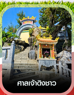
ศาลเจ้าดิ้งซาอ