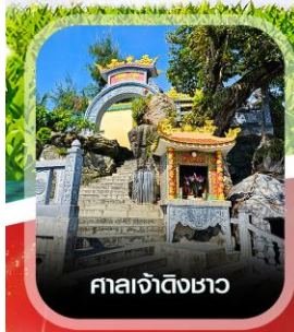
ศาลเจ้าดิงเซา