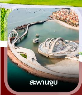
สะพานจูบ

✈️ คอนเฟิร์ม ออกเดินทาง ทุกพีเรียด 2 ท่านขึ้นไป