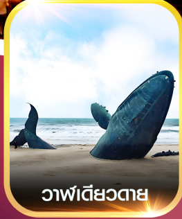
วาฬเดี่ยวตาย

✈️ คอนเฟิร์มออกเดินทาง ✈️ ทุกพีเรียด 2 ท่านขึ้นไป