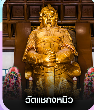
วัดเชกหงหมิว