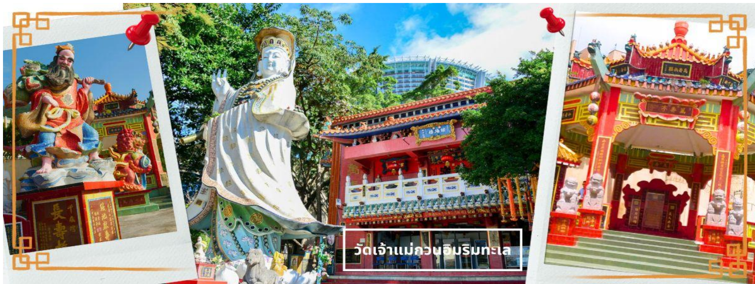
วัดเจ้าแม่กวนอิมริบทะเล

ความศักดิ์สิทธิ์ และยังมีเจ้าแม่ทับทิม หรือเทพธิดาแห่งท้องทะเลองค์ใหญ่ ซึ่งคนฮ่องกง คนมาเก๊า และคนจีน ที่อยู่ริมทะเล ชาวประมง นักเดินเรือหรือผู้ที่เดินทางทางเรือเป็นประจำ จะนับถือเจ้าแม่ทับทิมเป็นอย่างมาก มีความเชื่อว่าเจ้าแม่ทับทิมจะปกป้องเราจากภัยอันตรายระหว่างการเดินทาง ภายในวัดยังมีเทพเจ้าและพระพุทธรูปต่างๆ ประดิษฐานไว้มากมายตามความเชื่อศรัทธา เช่น เทพเจ้าไฉ่ซิงเอี้ย ไหว้ขอโชคลาภความมั่งคั่ง ความร่ำรวย, พระสังกัจจายน์โพธิสัตว์ เทพประทานบุตร-ธิดา ไหว้อธิษฐานขอลูก, สะพานต่ออายุ (สะพานอายุยืน) สะพานสีแดงตั้งอยู่บนริมหาด สีแดงสด เชื่อกันว่า คนจีนเชื่อกันว่าหากเดินข้ามสะพานนี้ เราจะมีอายุยืนขึ้นอีก 3 วัน (3 วัน บนสวรรค์ = 3 ปี บนโลกมนุษย์) นั่นหมายความว่า ถ้าเราเดินข้ามสะพานนี้แล้ว จะมีอายุยืนยาวขึ้นอีก 3 ปี บนโลกมนุษย์, เทพเจ้าแห่งความรัก ไหว้ขอเนื้อคู่, ศาลา 8 เหลี่ยม เชื่อกันว่าเป็นจุดที่มีดวงจupiterดีที่สุด ภายในศาลาแปดเหลี่ยม จุดกึ่งกลางของพื้นจะมีรูปแปดเหลี่ยม ให้เราไปยื่นขอพรจากตำแหน่งนี้เพื่อขอพลังจากสวรรค์ และอีกมากมาย