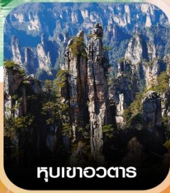
หุบเขาอวดตาร

คอนเฟิร์มออกเดินทาง ทุกพีเรียด 2 ท่านขึ้นไป