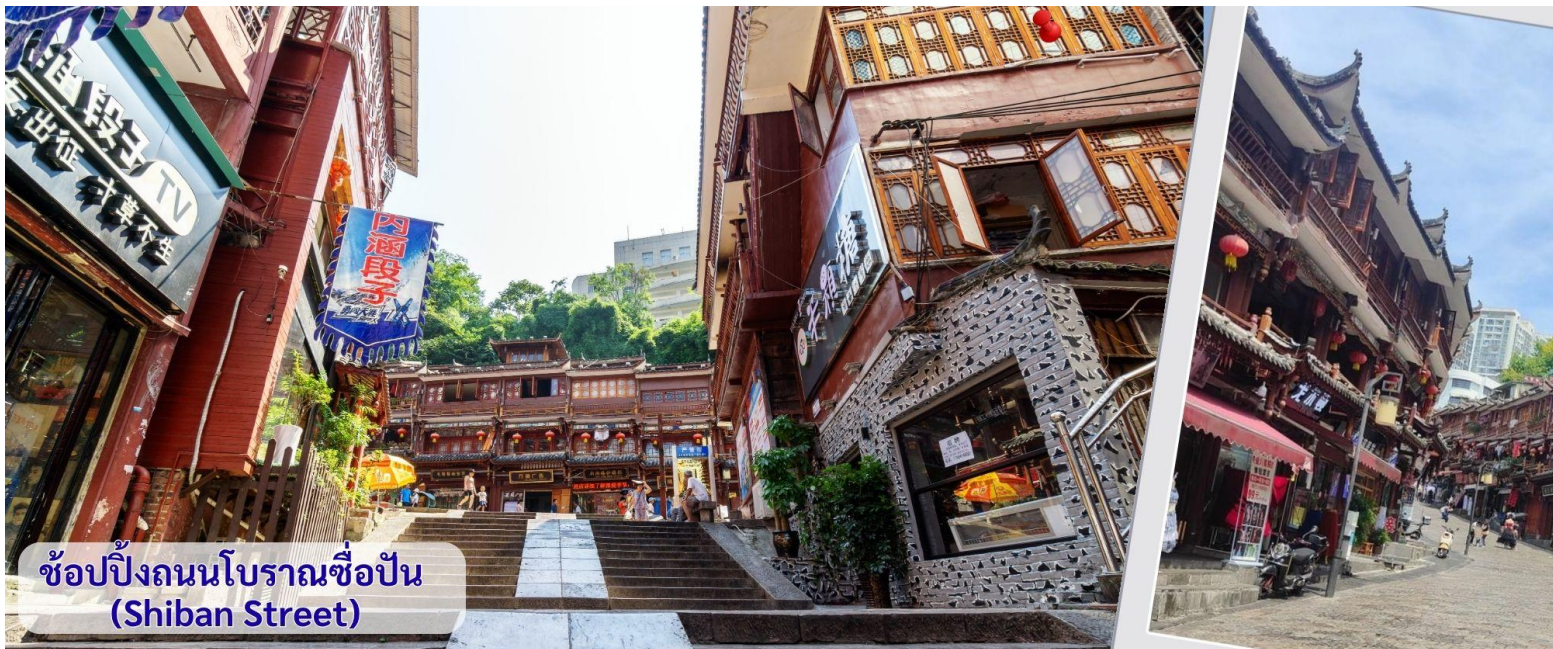
ช้อปปิ้งถนนโบราณช้อปปิ้ง (Shiban Street)

จากนั้นนำทุกท่าน เดินถนนโบราณ Feng Huang Ancient Town ที่ถนนช้อปปิ้ง Shibanshi Street เมืองที่ยังคงรักษาเอกลักษณ์ความเป็นพื้นเมืองผสมผสานกับยุคปัจจุบันเอาไว้ได้อย่างลงตัววิถีชีวิตของชาวบ้านที่อาศัยอยู่ที่นี้ บรรยากาศในเมืองเฟิงหวาง ถนนเก่าช้อปปิ้งเป็นถนนปูหินแคบๆ กว้างไม่ถึง 5 เมตร ทอดยาวจากทางเข้าวัดเต้าเหมินไปทางทิศตะวันตก ผ่านถนนหลายสาย ได้แก่ ถนนนครอส ถนนเจิ้งตวันออก ถนนเจิ้งตวันตง ศาลาฮุยหลง หียงเซียวซง เต้าซานลา ศาลาเจี้ยกัว และสุสานเซินฉงเหวิน สุดท้ายจะนำไปสู่ “น้ำพุแรกใต้ฟ้า” ถนนสายนี้มีความยาวกว่า 3,000 เมตร และเป็นย่านการค้าที่คึกคักที่สุดในเฟิงหวาง