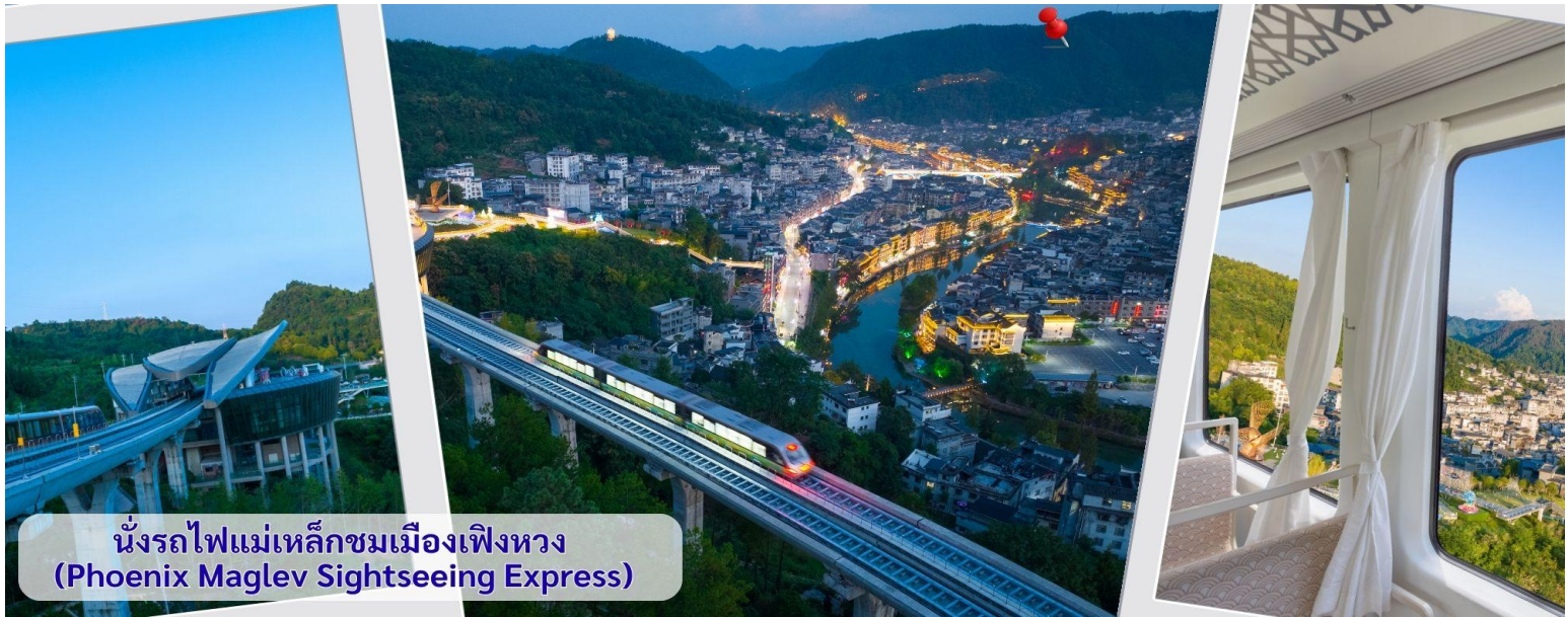
นั่งรถไฟแม่เหล็กชมเมืองเฟิงหวาง (Phoenix Maglev Sightseeing Express)

จากนั้นนำทุกท่าน เดินถนนโบราณ Feng Huang Ancient Town ที่ถนนช้อปปิ้ง Shibanshi Street เมืองที่ยังคงรักษาเอกลักษณ์ความเป็นพื้นเมืองผสมผสานกับยุคปัจจุบันเอาไว้ได้อย่างลงตัววิถีชีวิตของชาวบ้านที่อาศัยอยู่ที่นี้ บรรยากาศในเมืองเฟิงหวาง ถนนเก่าช้อปปิ้งเป็นถนนปูหินแคบๆ กว้างไม่ถึง 5 เมตร ทอดยาวจากทางเข้าวัดเต้าเหมินไปทางทิศตะวันตก ผ่านถนนหลายสาย ได้แก่ ถนนนครอส ถนนเจิ้งตวันออก ถนนเจิ้งตวันตง ศาลาฮุยหลง หียงเซียวซง เต้าซานลา ศาลาเจี้ยกัว และสุสานเซินฉงเหวิน สุดท้ายจะนำไปสู่ “น้ำพุแรกใต้ฟ้า” ถนนสายนี้มีความยาวกว่า 3,000 เมตร และเป็นย่านการค้าที่คึกคักที่สุดในเฟิงหวาง