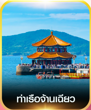
ท่าเรือจันทิว