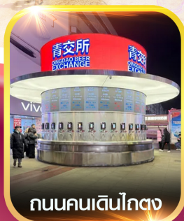
ถนนคนเดินโกตง